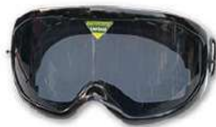
Occhiali versione notturna Alcolemia percepita 0.6 - 0.8 g/l

Gli occhiali Alcovista® "ALCOL" sono un ottimo strumento per sensibilizzare le persone di tutte le età, sulle conseguenze dell'eccessivo consumo di alcol.