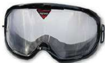
Occhiali versione diurna Alcolemia percepita 1.0 - 1.5 g/l