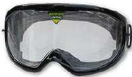
Occhiali versione diurna Alcolemia percepita 0.6 - 0.8 g/l