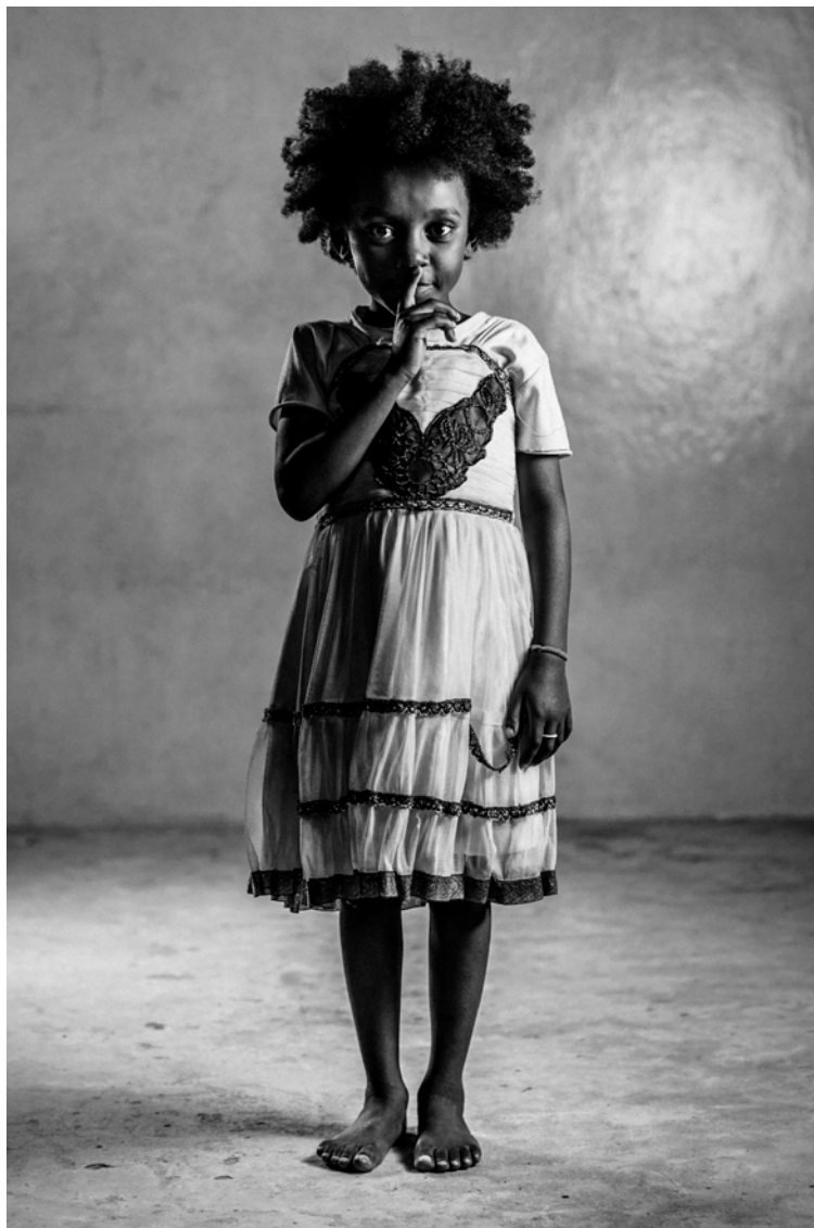
PRESENTE - 16 ritratti di bambini del centro Anidan stampati su tessuto 70x200