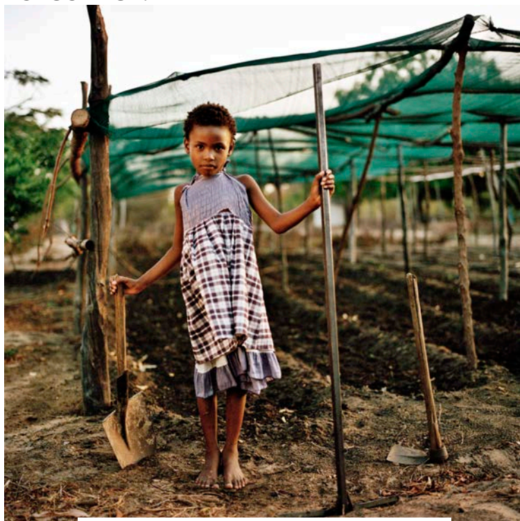
FUTURO - I sogni dei bambini di Anidan a colori