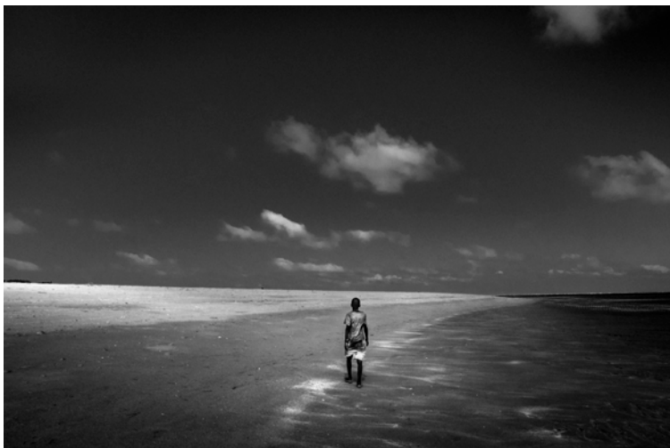
PASSATO - La vita dei bambini dell'isola di Lamu al di fuori del centro Anidan